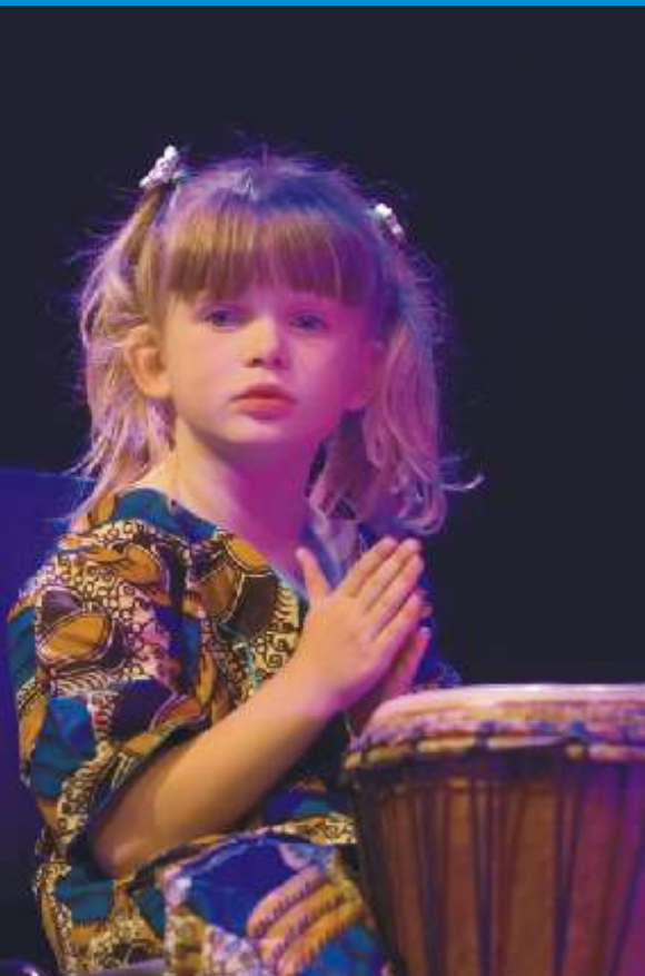
(foto links: een meisje van de djembégroep uit Emmen op het Majoor Bosshardtgalá in Carré.)

Op 1 april 2009 was er het jeugdzorgevent ‘Erbij’. Aanleiding: een aantal jubilerende afdelingen en de wens om jeugdigen hun talenten te laten ontdekken en te prikkelen aansluiting te zoeken in de maatschappij. Gedeputeerde Pim de Bruijne gaf om 14.00 uur het startschot voor een middag met 15 workshops voor zo’n honderd jeugdigen uit de jeugdzorgafdelingen. Er waren twee rondes met een workshop naar keuze. Tijdens een jubileumbijeenkomst voor genodigden ‘s avonds sprak de gedeputeerde zijn felicitaties uit aan de Jeugdhuizen Veendam (75 jr), Jeugdhuizen Groningen (50 jr), Gezinsopvang (25 jr) en ‘10’ Voor Toekomst (10 jr). Ook zei hij zeer tevreden te zijn over de samenwerking tussen het Leger des Heils en de provincie Groningen. ■